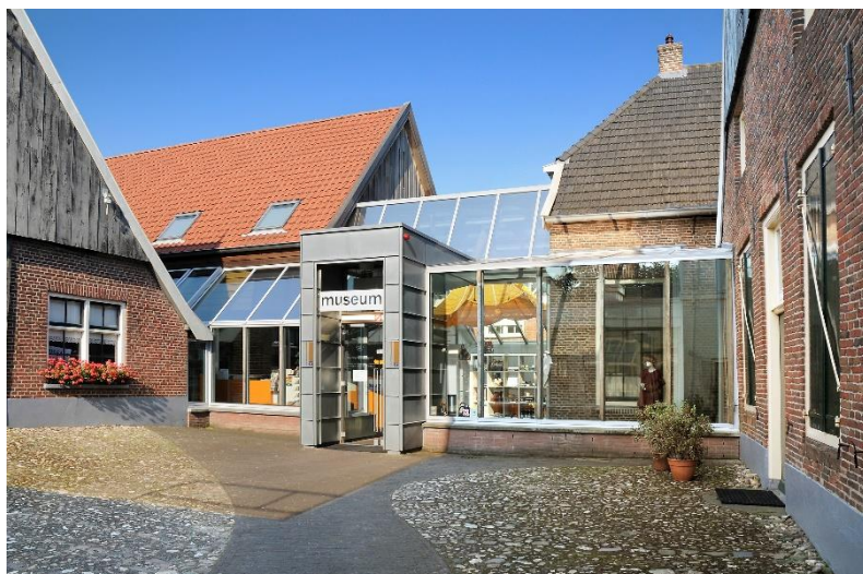
Nationaal Onderduikmuseum Aalten

Na de inleiding volgt een bezoek aan het Nationaal Onderduikmuseum en het gemeentehuis aan de markt te Aalten. Bij beide gebouwen zijn door diverse verbouwingen verschillende bouwstijlen waarneembaar.