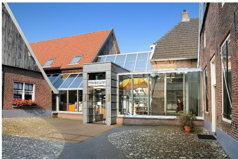
Nationaal Onderduikmuseum Aalten

Na de inleiding volgt een bezoek aan het Nationaal Onderduikmuseum en het gemeentehuis aan de markt te Aalten. Bij beide gebouwen zijn door diverse verbouwingen verschillende bouwstijlen waarneembaar.