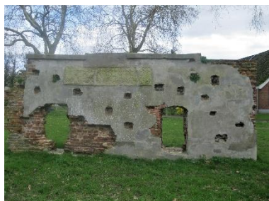
Foto: De eeuwenoude muur op 't Waliën wordt als bouwsteen gebruikt in het educatie- en participatieproject van Cultuur- en Erfgoedpact Achterhoek in samenwerking met KunstOer.

Het meerdaags kunstevenement KunstOer vindt plaats in het Pinksterweekend op 8, 9 en 10 juni. Drie dagen lang exposeren 11 professionele kunstenaars op 11 mooie erfgoedlocaties in en rondom Winterswijk. Beeldende kunst, erfgoed en natuur komen samen tijdens deze unieke meerdaagse kunstmanifestatie met exposities van diverse kunstvormen. KunstOer 2019 betekent drie dagen lang bijzondere erfgoedlocaties in Winterswijk en het buitengebied bezoeken waar professionele kunstenaars hun werk – van robuust tot heel minuscuul – tentoonstellen.